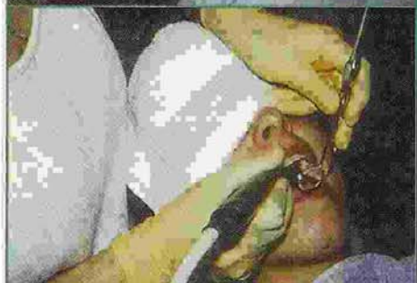
Abb. 4 und 5: Mit wenig Aufwand lässt sich der Aufenthalt im Behandlungsstuhl für den Patienten komfortabler machen.