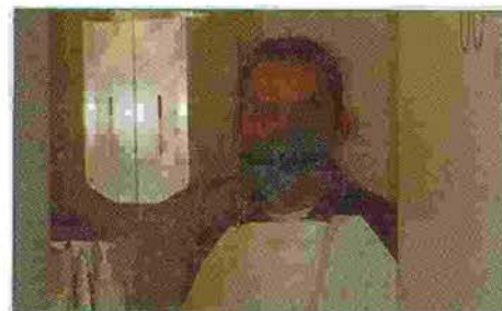
Abb. 1: Die „kleine Behandlungspause“ wird so für den Patienten wohl weniger erholsam.

An seinem Beispiel wird die perfekte Dienstleistungspraxis vorgestellt, mit praktischen Darstellungen, nicht nur wie häufig als Gliederung. Neben den reinen zahnärztlichen Tätigkeiten – Eingangsgespräch, Patienten-Motivation und -Selektion, Behandlungsplanung, professionelle Zahnreinigung, Systematik und Zeitmanagement bei umfangreichem Behandlungsbedarf (Langzeitsitzung) und dem Nachsorgekonzept werden administrative Themen bespro-