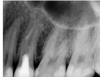
Abb. 6 Instrumenten- fraktur

man – meist sogar mit besseren Erfolgsaussichten – immer noch chirurgisch eingreifen (Abb. 4).