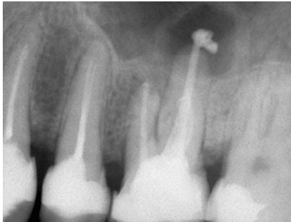
Abb. 5 Überfüllung eines Wurzelkanals