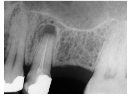
Abb. 4 Wurzelspitzenresektion und insuffiziente Wurzelfüllung – hier ist ein Misserfolg programmiert

Wenn der Patient dem Rat nicht folgt und auf einer Extraktion besteht, sollte man sich dies schriftlich bestätigen lassen, um bei eventuellen späteren Streitigkeiten gerüstet zu sein, oder zumindest den Namen der Mitarbeiterin notieren, die bei diesem Gespräch dabei war. Sofern die Extraktion, welche meistens keine Notfallmaßnahme darstellt, geplant durchgeführt werden soll, empfiehlt es sich, dem Patienten mindestens einen Tag Bedenkzeit zu gewähren.