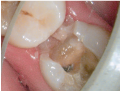
Abb. 12 Toxavit- Nekrose

der GOZ eine rechtliche Verpflichtung für den Zahnarzt, mit einer Vergrößerungshilfe zu arbeiten.