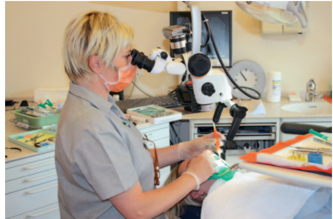
Abb. 11 Einsatz eines Operationsmikroskops bei der endodontischen Behandlung

Die maschinelle Aufbereitung mit Nickel-Titan-Feilen ist heute weitverbreitet, wird aber von zahlreichen Kollegen immer noch nicht praktiziert. Auch gibt es keine Empfehlungen zur Pflichtanwendung von Nickel-Titan-Feilen. Die Ergebnisse mit Stahlfeilen sind oft Frakturen durch falsche oder überzogene Belastung, ein unzureichender Erhalt der Kanalkrümmung mit anschließender insuffizienter Wurzelkanalfüllung und/oder eine vermeidbare Zahnentfernung, da die Wurzelkrümmung eine Aufbereitung angeblich unmöglich macht. Eine interessante Frage ist, ob man heute einen Zahnarzt in die Haftung nehmen kann, der keine rotierenden Nickel-Titan-Feilen