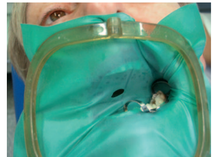
Abb. 10 Kofferdam mit „Atemloch“ bei erschwerter Nasenatmung