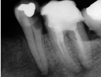
Abb. 1 Endodontischer Schmerzfall