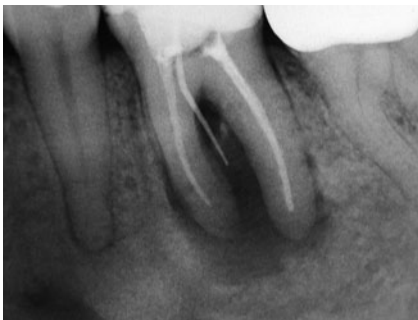
Abb. 8 Via falsa

Der erste Schritt, seine endodontische Therapie zu optimieren, ist die Verwendung von Kofferdam (Abb. 10), der in Deutschland unverständlicherweise immer noch