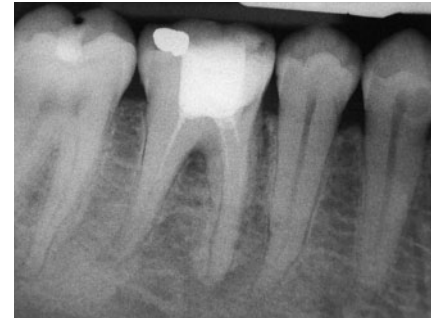
Abb. 13 „Homöopathische“ Wurzelkanalfüllung – Revision erforderlich

Sehr interessant für den Endodontologen ist natürlich die Frage, ob die Revision eines beherdeten, bislang aber schmerzfreien Zahnes versichert ist, wenn der Befund schon bei Versicherungsabschluss vorgelegen, eine diesbezügliche Behandlung aber noch nicht stattgefunden hat (Abb. 13). Obwohl dazu keine obergerichtlichen Entscheidungen bekannt sind, sehen die Juristen einen solchen Befund als versichert an. Denn nicht die Erkrankung an sich lässt den Versicherungsschutz entfallen, sondern nur die zahnmedizinische Behandlung, die vor Abschluss der Versicherung begonnen wurde (vgl. hierzu AG Hamburg-Barmbek, Az. 814 C 87/11). Und genau dies ist der Grund, warum die Versicherungen Krankenakten und Röntgenaufnahmen im Vorfeld einfordern: Sie wollen und müssen feststellen, ob die üblichen Selbstauskünfte ihrer Versicherten der Wahrheit entsprechen. Da der Patient Anspruch auf eine – kosten-