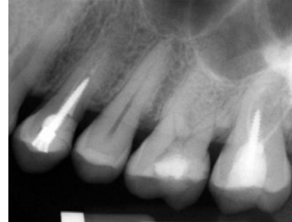
Abb. 2 Möglichkeit der Stiftentfernung

Allerdings reicht – zumindest bei kleineren Maßnahmen – die mündliche Aufklärung mit einem Vermerk in der Patientenakte und vielleicht dem Namen einer anwesenden Mitarbeiterin, die das Gespräch im Bedarfsfall bezeugen kann. Hilfreich und zeitsparend ist es, in der Praxis die verschiedenen Aufklärungsabläufe schriftlich zu fixieren, so dass dann bei der mündlichen Aufklärung immer auf diese Vorlagen zurückgegriffen werden kann. Damit wird die eventuelle Aussage einer Mitarbeiterin bezüglich des Aufklärungsinhaltes vor Gericht glaubhafter erscheinen: „Das erklären wir immer so!“ Allerdings ist nach einem neueren Urteil des Bundesgerichtshofs (BGH) vom 20.07.2010 (Az. VI ZR 204/09) in einfach gelagerten Fällen auch eine fernmündliche Aufklärung möglich. Es bleibt abzuwarten, wie sich die Handhabung der Aufklärung weiter entwickeln wird. Für chirurgische und endodontische Überweiserpraxen wäre die telefonische Aufklärung eine große Erleichterung, um die notwendige Bedenkzeit des Patienten sicherzustellen.