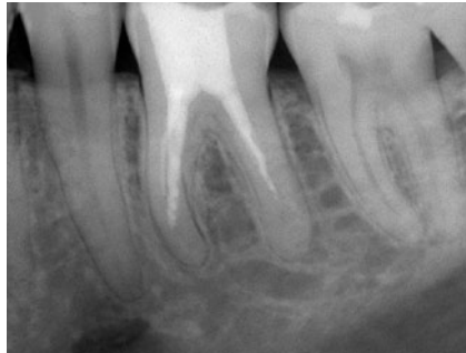
Abb. 3 Revisionsfall

in Organen und Gelenken muss vor einer Wurzelkanalbehandlung nicht aufgeklärt werden (OLG Stuttgart, Urteil vom 12.09.1996, Az. 14 U 1/96).