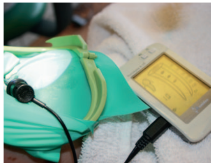
Abb. 9 Elektrische Längenmessung